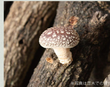
※写真は原木での栽培

家庭でのしいたけ作りといえば「原木栽培」ですが、管理が結構大変。そこで最近人気なのが、おがくずに菌を植えつけた菌床栽培。キット販売されており、育て始めて5日目から収穫できる手軽さ。小振りなので室内栽培でき、成長過程も見えます。収穫はカサが開ききる前に、1日2回、霧吹きで水やりを！