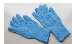
マイクロファイバー素材の手袋は、100均やホームセンターで手に入ります。