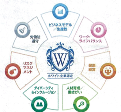
▲同社は「ホワイト企業認定」でゴールドを取得した。全5段階のうち上から2番目のランクだ

「休みや家族の時間を充実したい人に必要だ」と思い、一般職を設けました。営業職で土日休みは