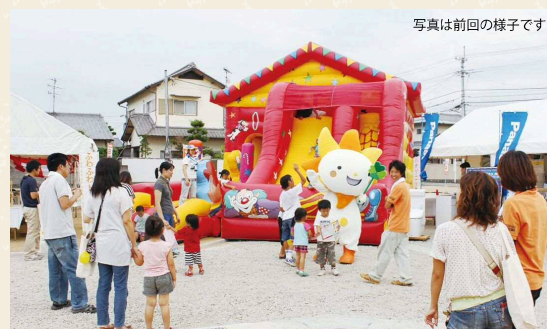
写真は前回の様子です