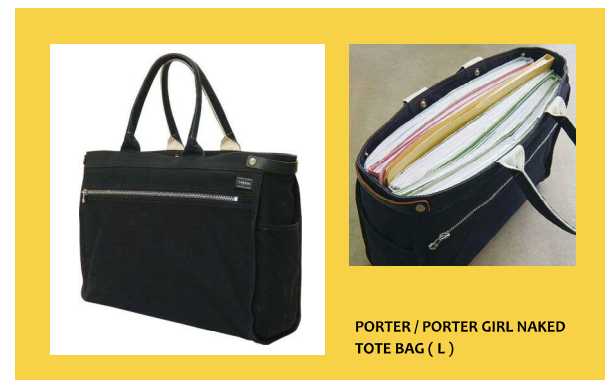
PORTER / PORTER GIRL NAKED TOTE BAG (L)

職人さんからの問い合わせにすぐに対応できるよう、普段から担当しているすべての建築中物件の図面を持ち歩いています。A3ファイル13冊、重さは11.4kgと、かばんは裂けそうな位いつもパンパン！ 使い初めて1年強、毎日ヘビーユースしていますが、いまだへたる様子は見えませんね。